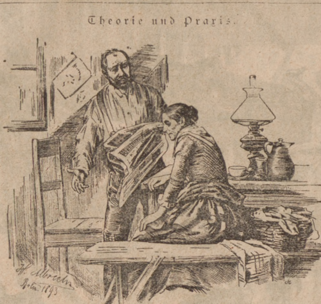
Theorie und Praxis.

Bülow und die Matrone. Während eines Konzerts Hans von Bülow's in den achtziger Jahren erregte folgender Vorfall große Heiterkeit: Als plötzlich die Musik veritunnte, hörte man in dem überfüllten Saal eine Matrone zu ihrer Nachbarin sagen: „... — und ich koche sie immer mit Peterilie!“ Alle Anwesenden lachten, das Lachen wurde aber zu einem nicht enden wollenden Gelächter, als Bülow sich an die Sprecherin wendend, sagte: „Nicht wahr, Madame, Ihr Genuß war eben bei den Fischen?“