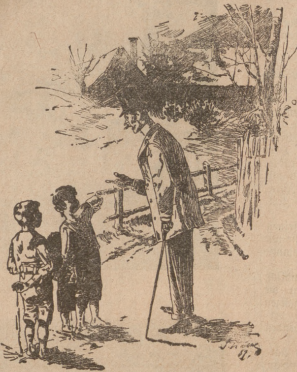
Gigerl: „Sagt einmal, warum habt Ihr mich vorhin mit Schmutz beworfen?“ Dorfjungen: „Ja, wir haben eben nir andres gehabt!“

Reinkulturen des Heuschreckenpilzes zu züchten. Vermittelt dieses Pilzes will man eine vernichtende Seuche unter die Heuschreckenschwärme, die oft die Feldfrüchte ganzer Provinzen vernichten, zu bringen suchen, und hofft so die