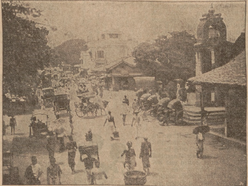
Colombo mit Rathaus.