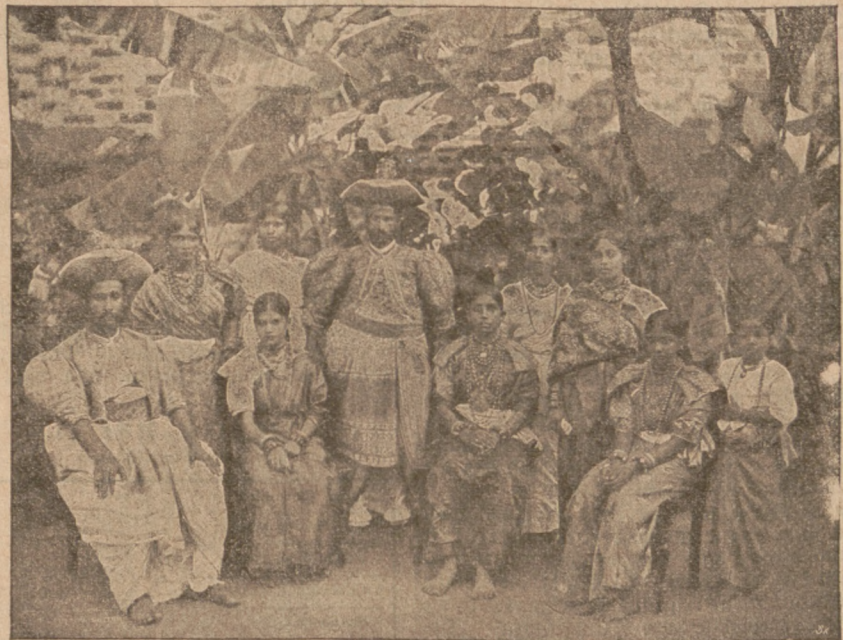
Häuptling mit Familie.

Die Bevölkerung der 64000 Quadratkilometer großen Insel Ceylon setzt sich zumeist aus Singhalesen zusammen, einem schönen Menschengeschlag, der aber leider dem Prinzip des Berliner Sonnenbruders: „Wer die Arbeit kennt, geht ihr aus dem Wege“ in weitgehendem Maße huldigt. Die ungeheure Ausdehnung der Hauptstadt selber — Colombo —, die denselben Flächeninhalt wie Paris hat, nimmt derselben jeden stadtbühnlichen Charakter. Ein reges Leben herrscht in den Quartieren der Eingeborenen, zumal in der Nähe des Marktes, mit seinen verlockenden Früchten — Ananas, Bananen, Melonen, Kürbissen, Orangen zc. Nahe dem Rathause befinden sich kleinere, an den Seiten offene Markthallen und dicht dabei gemauert und noch ein altertümlicher Glockenturm an die Herrschaft der Holländer.