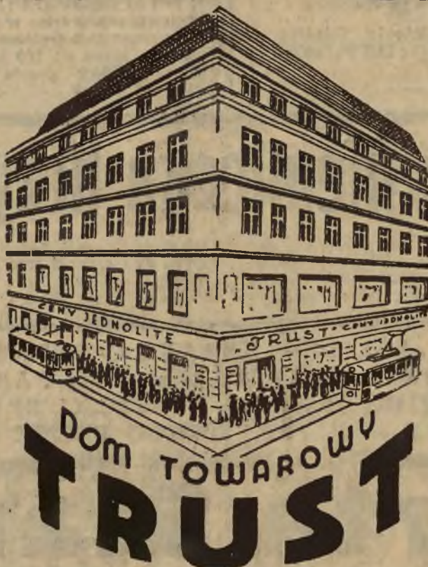
Hetmańska 12 — Gródecka 85 Uniwersalne sklepy, gdzie wszystko można nabyć najlepiej, najtaniej i najsolidniej.

Obok jednostek pływających, t. j. okrętów wybrzeża morskiego bronić mo-