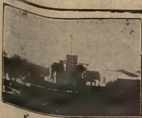
Kapitanat portu w Gdyni

Pozatem zwykłe rubryki: Sprawy kolonialne, przegląd prasy zagranicznej, z życia marynarki wojennej i kronika bieżąca. (R).