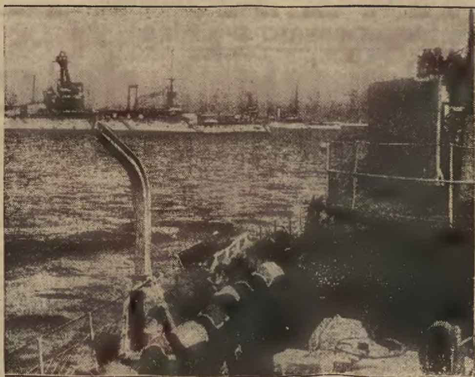
Fragment z przegranej bitwy wojennej francuskiej podczas wielkich manewrów w porcie Brest.

SKUTKI POWODZI W JAPONJI TOKIO, 2. VII. (PAT). Według ostatnich wiadomości powódź w południowo zachodniej Japonji dokonała znacznie większego spustoszenia, niż pierwotnie przypuszczano. 90 osób utraciło życie, 20 osób zaginęło, 300 jest rannych, 1.700 domów zupełnie zniszczonych, 200.000 zabudowań znajduje się pod wodą.