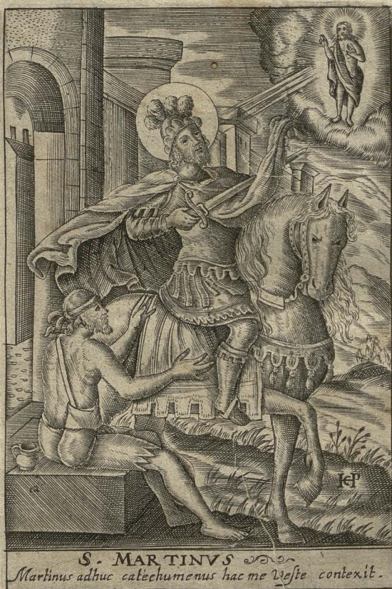
S. MARTINVS Martinus adhuc catechumenus hac me veste contexit.

In imaginem S. MARTINI Tutelarior Ecclesiæ Clobucensis, pauperi seminudo chlamy- dem largientis.