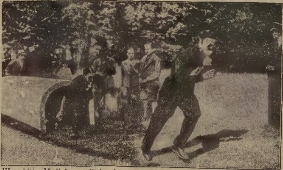
W pobliżu Medjolanu odbyły się oryginalne wyścigi w maskach gazowych. Start następował... z tunelu, jak to wiadać na ilustracji. Wyścigi organizowały władze wojskowe.

złoto, srebro, perły, diamenty, złote zęby, oraz kartki zastawnicze, kupuje REUTERMAN Lwów, Piotrowska 19. JAK OGŁASZAC — TO W „KURJERZE”