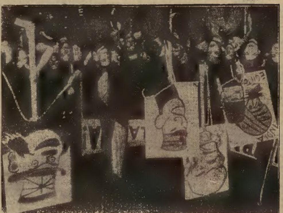
WOJENNE DEMONSTRACJE WE WŁOSZECH. — Demonstracyjny pochód przez ulice Rzymu, przy czym niesiono tablice z napisami i karykaturami zwró- conymi ostrzem przeciw Angliji i Japonji.

Magazyn Papieru. SCHEX I STENZEL Lwów, Sykstuska 2, tel. 34-98 polecza Papiery i przybory te- chniczne. 101