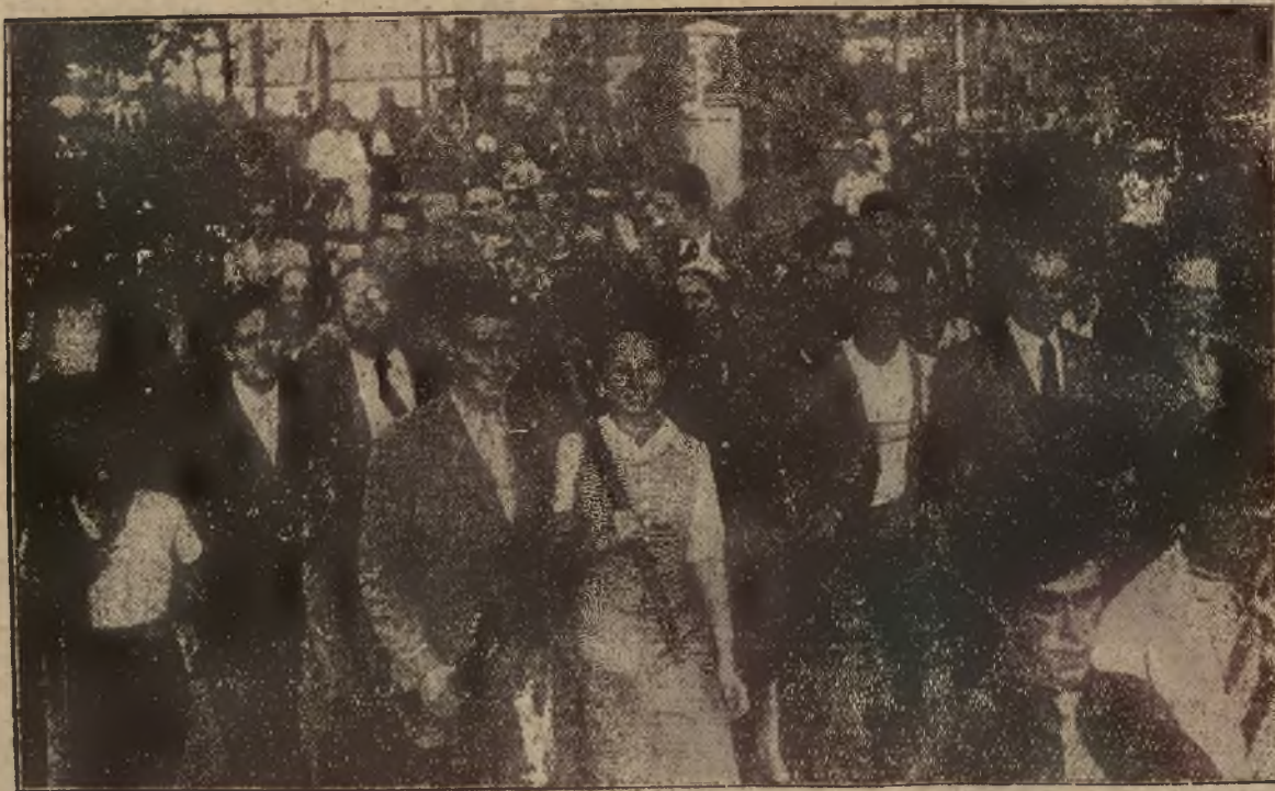
ZBRATANIE MŁODZIEŻY FRANCUSKIEJ I NIEMIECKIEJ. — Na wyspie Usedom zorganizowali Niemcy obóz letni dla młodzieży, w którym młodzież francuska żyje ma przez miesiące wakacyjne wspólnie z niemiecką. Na zdjęciu pochod młodzieży francuskiej, witanej owacyjnie.

Przybór wody na Wiśle wynosi po kilka centymetrów dziennie, podobnie do Bugu i Narwi; to samo w dorzeczu Prypeci, nieco więcej na Niemnie i Dźwinie. Dotychczasowe opady poprawiły warunki żeglugi i zasilily znacznie wody gruntowe nie powodując narazie nigdzie wystąpienia rzek z brzegów.