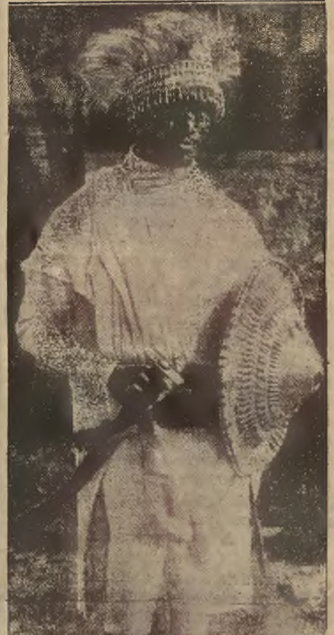
Wojownik abisyński w paradnym stroju. Zwraca uwagę oryginalne przybranie głowy włosami z grzywy lwa, oraz tarcza ze skóry bawolej.

ZAKOPANE, 4. 8. (PAT). Przybył wczoraj do Zakopanego w związku ze „Świętem gór“ prezes głównego komitetu i główny inicjator tegoż, kierownik Ministerstwa Spraw Wojskowych, gen. Kasprzycki.