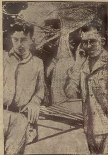
NOWY REKORD DŁUGOŚCI LOTU.

Katowice. 4. VIII. (PAT). Ligowy „Śląsk” wyjedzie do Wilna na dni 16 i 17 b. m. dla rozegrania dwóch spotkań z miejscowym WKS. Śmigły.