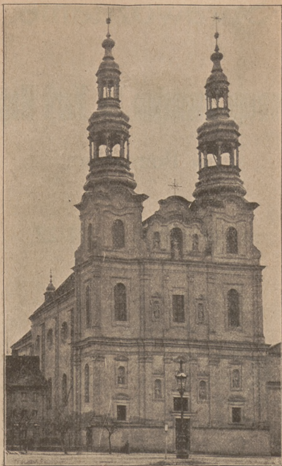
Kościół Gimnazjum Św. Marji Magdaleny, niegdyś OO. Bernardynów.