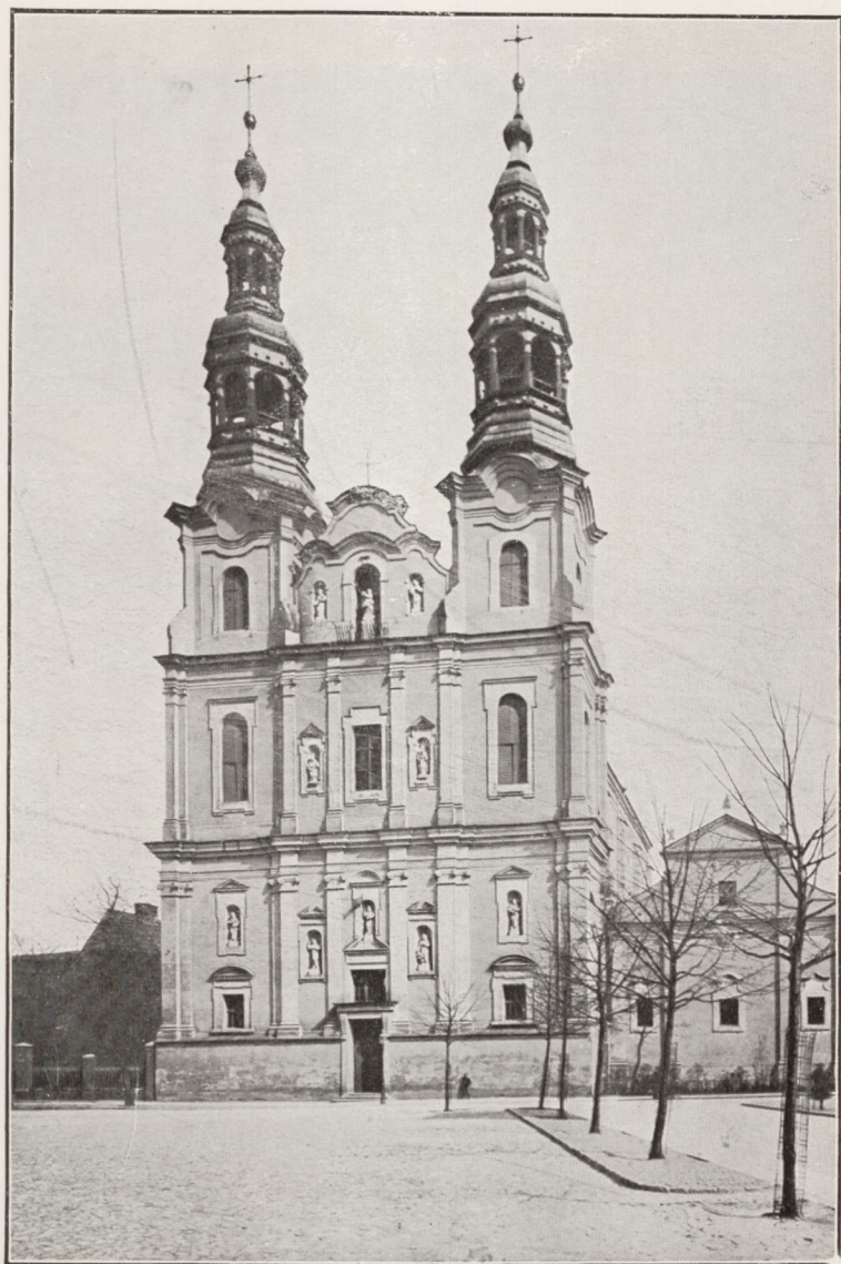
Kościół szkolny, dawniej O. O. Bernardynów