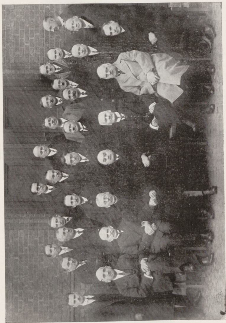
Rada Pedagogiczna na końcu roku szkoln. 1928/29