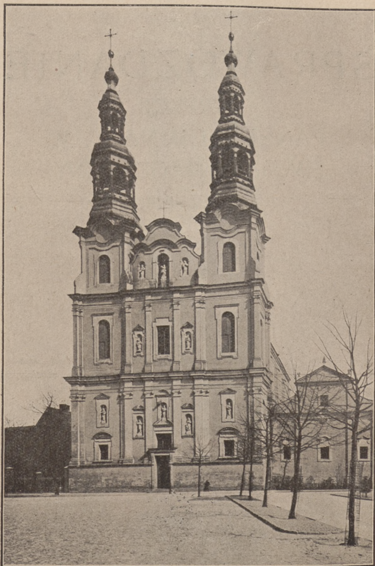
Kościół gimnazjalny pobernardyński