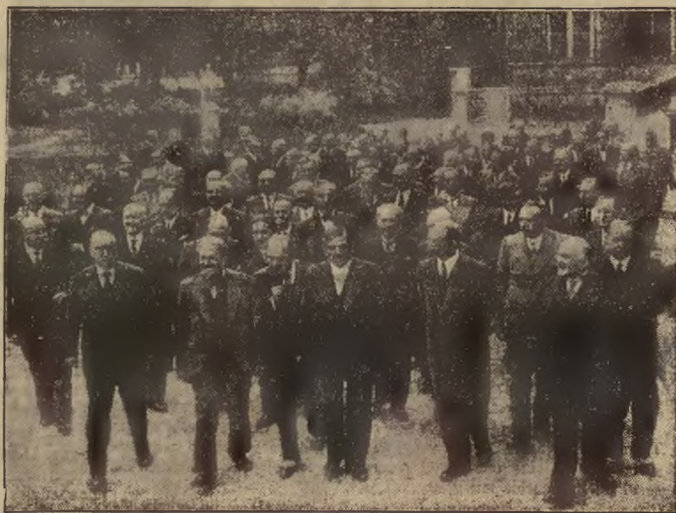
Wszyscy prefekci Francji zjechali do Paryża na wezwanie premiera Laval, aby odebrać od niego odpowiednie instrukcje. Na zdjęciu Laval w towarzystwie prefektów w ogrodzie Ministerstwa.