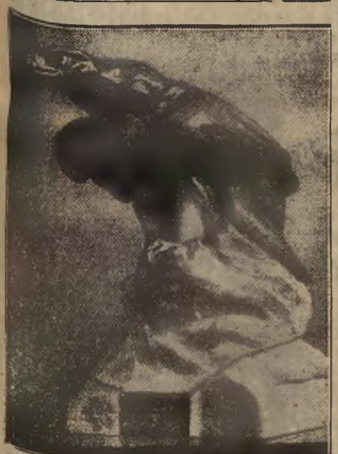
Nagroda wędrowna w zawodach regatowych kajaków w Gdańsku.

HAMBURG 15. 8. Po zakończeniu mistrzostw tenisowych Niemiec w Hamburgu odbył się turniej pocieszenia. W finale Henkel pokonał Frenza 6:3, 1:6, 6:3.