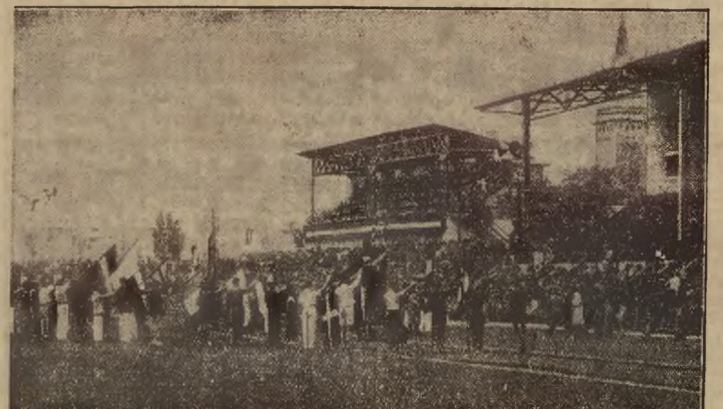
Moment z uroczystego otwarcia igrzysk akademickich w Budapeszcie; pocztów szandarowe reprezentacji państw przed trybunami.