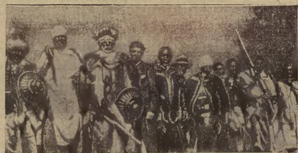
Malownicze stroje wodzów poszczególnych szczepów abisyńskich.

poleca najstarsza firma katolicka L. T. SKRZYPEK Lwów, Halicka 4, tel. 244-70. Specjalność: Obuwie szkolne.