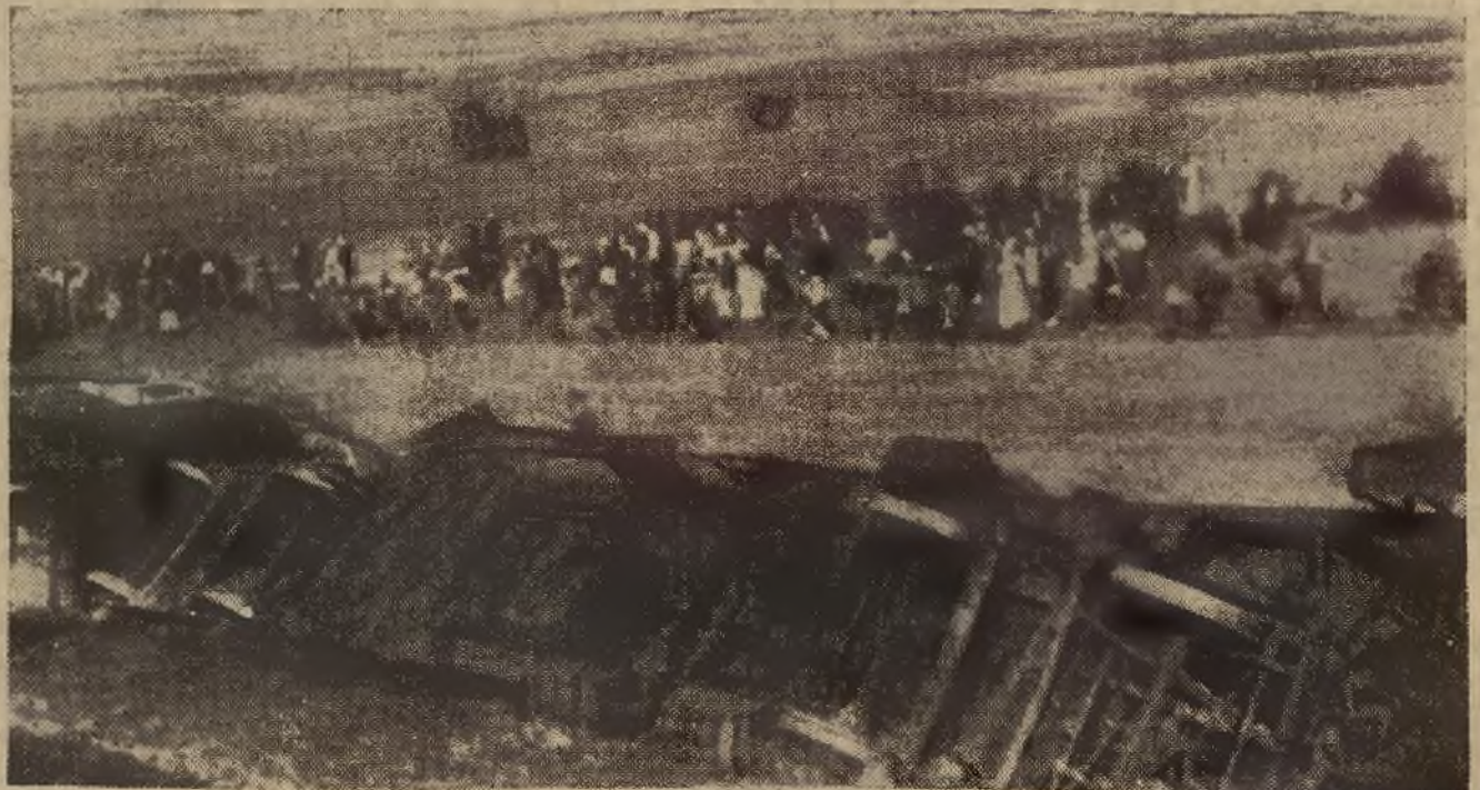
Oryginalne zdjęcie „Kurjera Lwowskiego” z terenu katastrofy międzynarodowego pociągu pospiesznego.