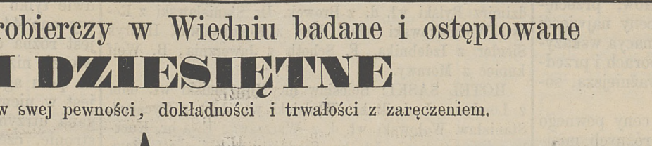
Czworokątna waga dziesiętna.