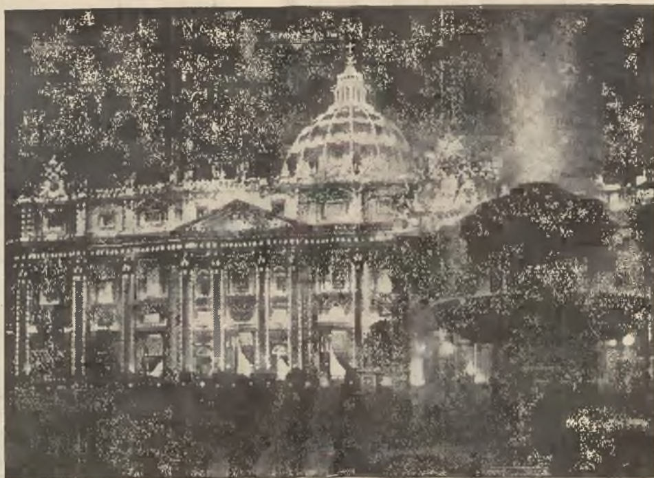
Bazylika św. Piotra w Rzymie, w pięknej iluminacji.

na biuro do wynajęcia we Lwo wie przy ul. Klementyny Tań skiej 3111. Wiado mość mieszka nie 3. 30361