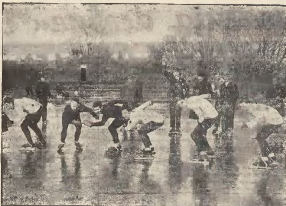
W Londynie odbyły się ostatnio wyścigi łyżwiarzkie pod gołym niebem. Zwyciężył dotychczasowy szampion Wyman.

łapczy i wypadaniu włosów działa skutecznie BIOCINOL Wyrób i Skład APTEKA MIKOŁASCHA Lwów. 2634