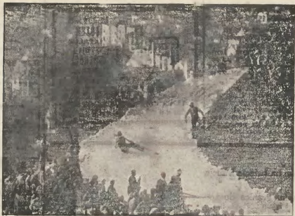
Prawdziwa sensacja dla narciarzy. W górach koło Berkeley (Kalifornia) odbyły się zawody narciarskie na śniegu dosłownie wozami nawiezionym.

Dziewczynę młodą zwaną gotującą przyjma katolicy Lwów Terezy 2c III/5. 12212