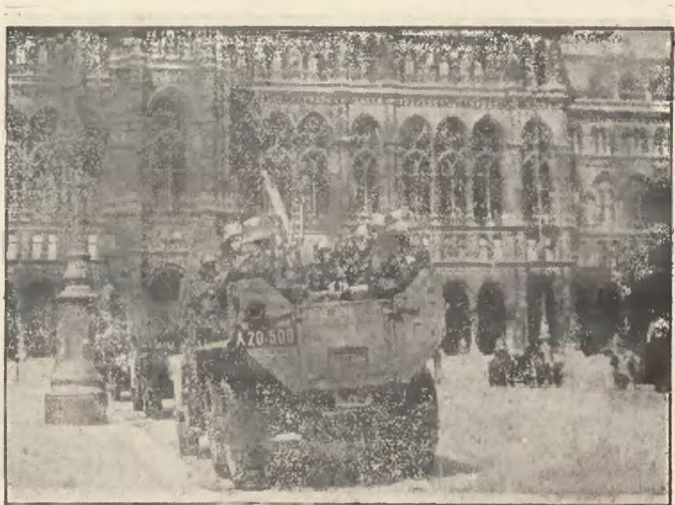
Pierwsze oryginalne zdjęcia walk ulicznych we Wiedniu. Przepiękny ratusz wiedeński otoczony wojskiem.

na rękawiczki, pierwszorzędne gatunki, Futro - Backes, Lwów, Legionów 19. 354