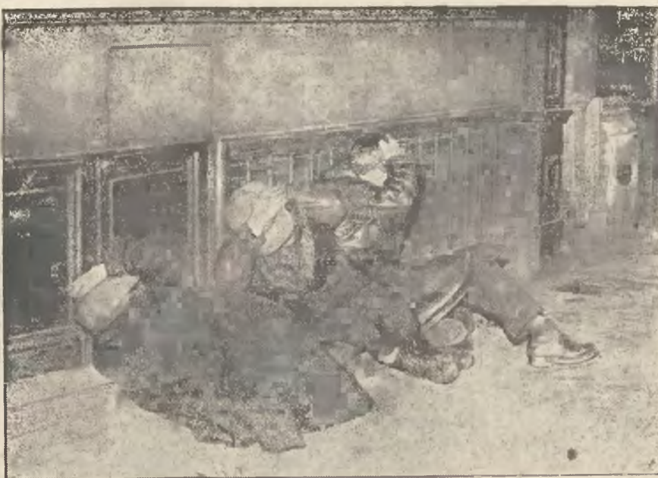
Z ostatnich wypadków paryskich. Trzej ranni chłopcy kryją się pod murami domów w czasie szarży policyjnej na pl. Republiki.

z kuchnią, bezdzietnym na rządowym stanowisku do wynajęcia 11 — 1. Lwów, Dworackiego 46. 12760