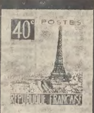
Nowe, artystycznie wykonane francuskie znaczki pocztowa