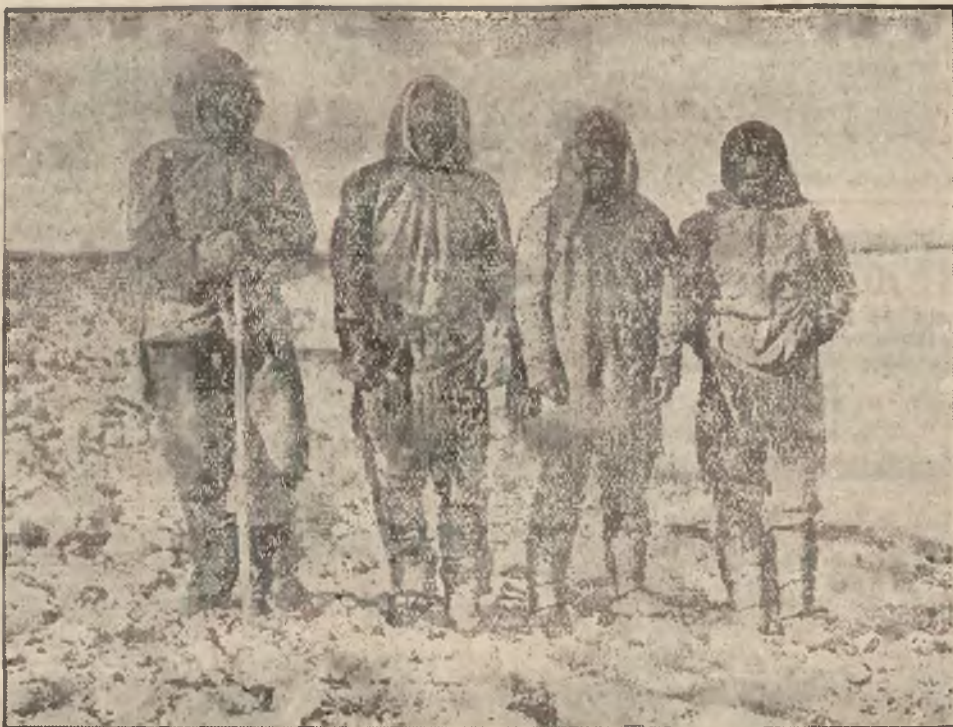
Eskimosi z nad jeziora Baker. Z misji OO. Oblatów.

łóżka nowe z rur kwadratowych okazyste sprze am. Listy Kur- jer, Lwów, Zimorowicza 10 pod „Wiedeńskie”. 15356