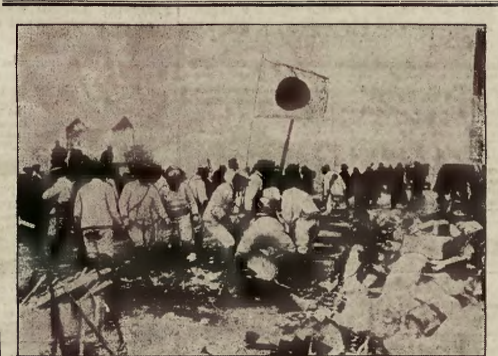
Miasto Hakodate w Japonii stało się pa stwą płomieni, przyczem zginęło około dwóch tysięcy ludzi. Do usuwania zgliszcz i ratowania pogorzalców zawezwano wojsko.

Dla 2 panów mieszkanie Lwów, Tkacka 8. l. p. 16143