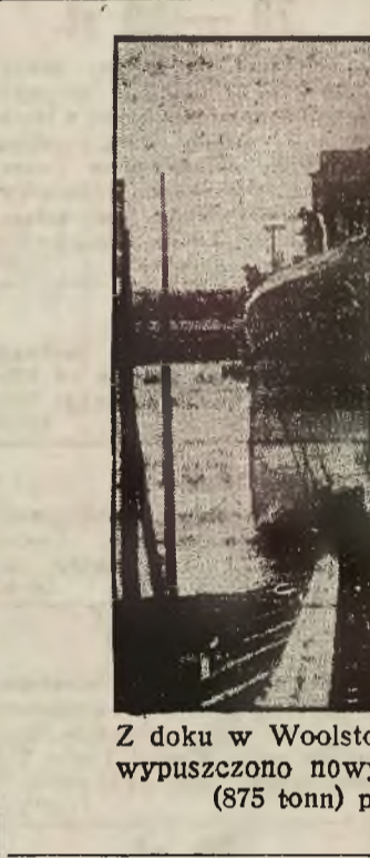
Z doku w Woolstone pod Southampton wypuszczono nowy minowiec angielski (875 tonn) p. n. „Harrier“.