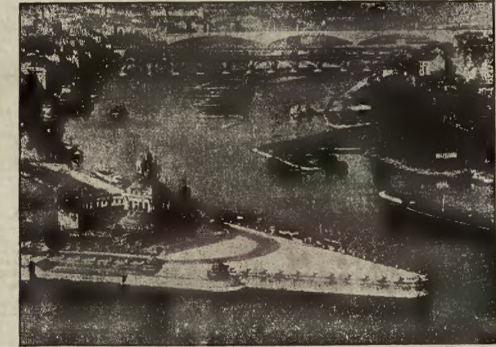
Interesujący obrazek z nad Mozeli z widokiem na nowy most, łączący Kobleniec z Lützel; największy to most betonowy w Europie pod nazwą „most Adolfa Hitlera”, którego otwarcie nastąpiło 22 kwietnia br.

Lwów, 3 pokoje kuchnia kom- fort II piętro od 1 czerwca do wynajęcia. — Oglądać można od 2 — 5. 17163