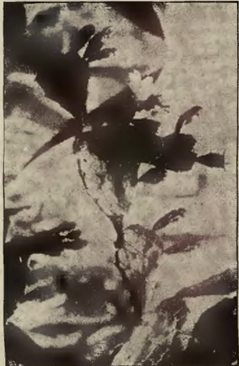
W pawilonie kaktusów zakwitła w tym roku cudownie opuncja.

W poznańskiej palmiarni jest niezwykle bogato reprezentowany dział roślin egzotycznych, rosnących w wilgotnych i wiecznie upalnych krajach podzwrotnikowych. Zarówno wielka zawartość wilgoci,