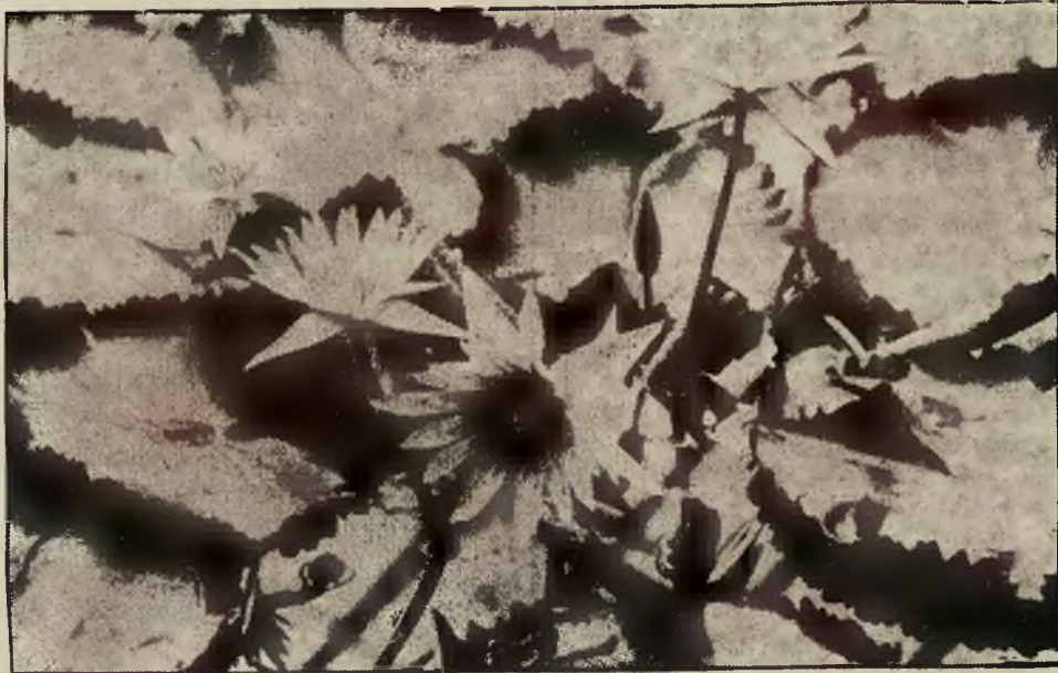
„rozkwitły wśród olbrzymich liści „Viktorji regii” — nimfeje.

W wielkim basenie, udestępnionym obecnie zwiedzającym, rozkwitły cudownie wśród olbrzymich liści „Viktorji Regii” — nimfeje. Ich piękne kolory, białe i czerwone, tworzą na spokojnej tafli basenu cudowne wzory. Część ich kwitnie w nocy