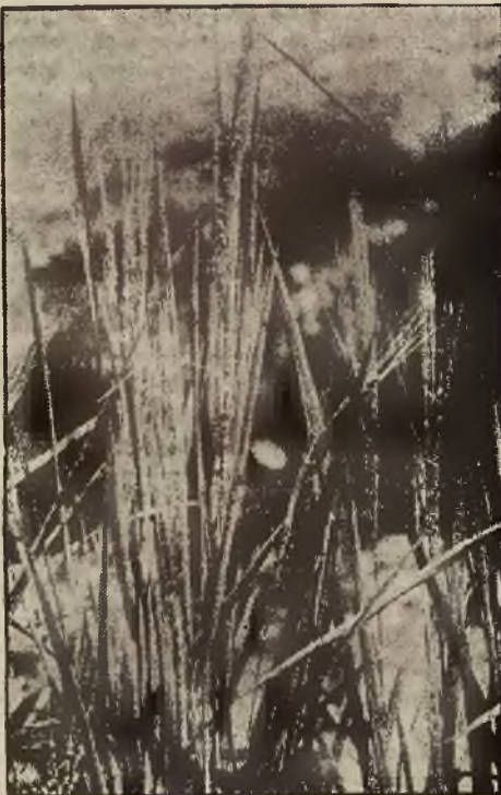
„dojrzała obecnie ryż.”

jak i wysoka temperatura przytłaczała pierś zwiedzającego. Odrzucając się, że weszliśmy w ojczyznę roślin podzwrotnikowych.