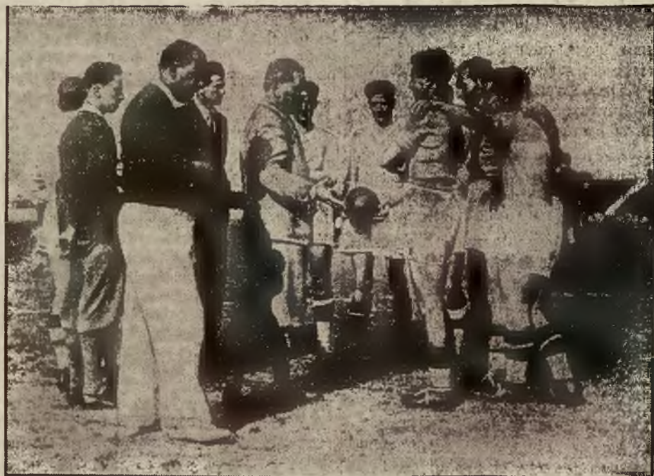
Rycina nasza przedstawia włoską jedenastkę narodową na boisku rzymskim w czasie treningu do decydującego rozgrywki o zaszczytny tytuł piłkarskiego mistrza świata.

wybieg piłkarski o mistrzostwo świata pomiędzy reprezentacjami Włoch a Czechosłowacji. Na meczu obecna była cała