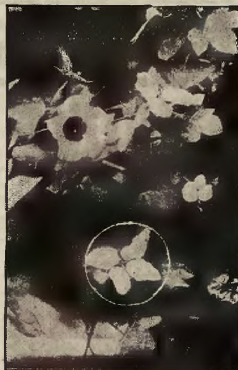
Kwitnący krzak bawołowy, (w kółku owoce).