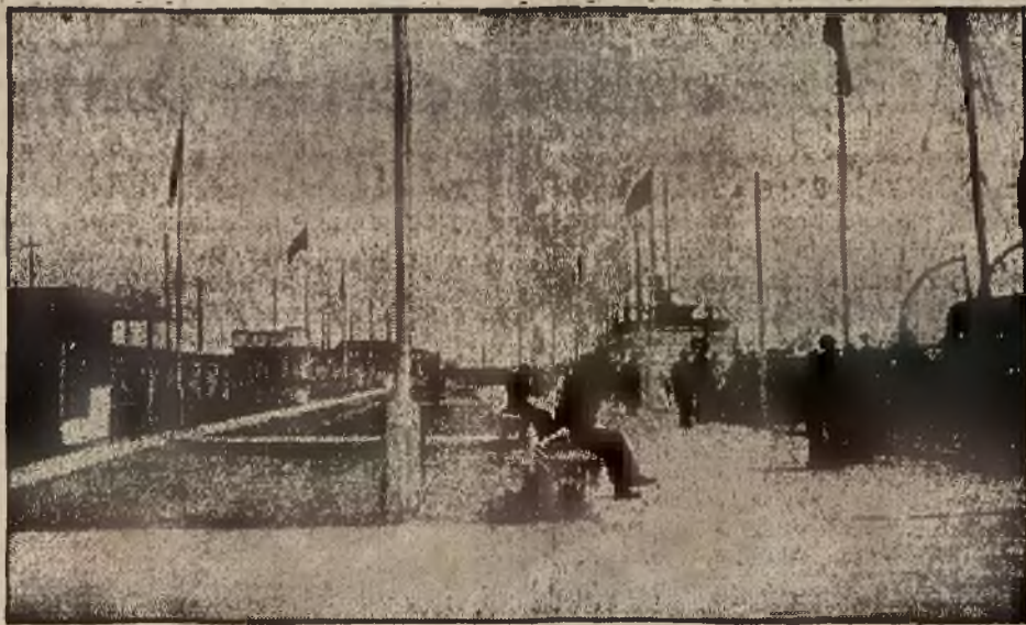
Gdynia: teren przystani.