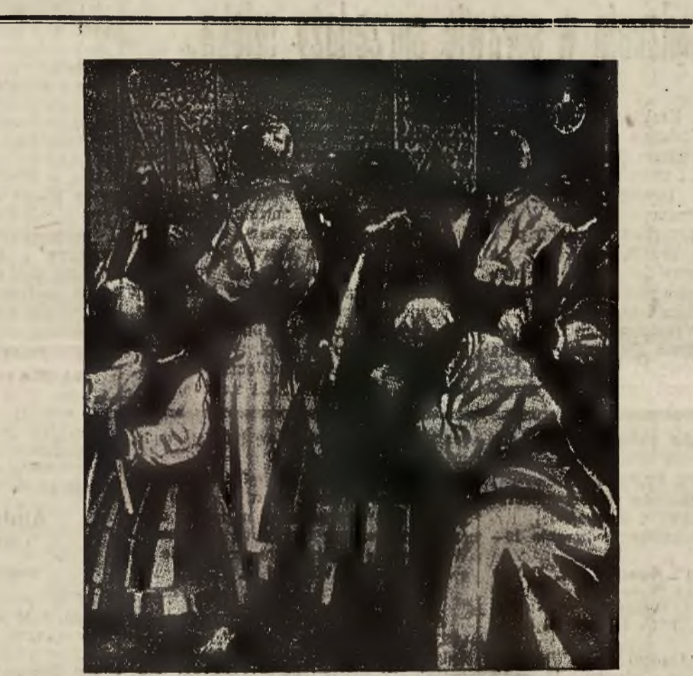
Procesja Bożego Ciała w Łowiczu (działo S. Norblina)

Spzedane Nie wyrzucajcie Swoich Pieniędy, kupując tandetę sklepową lecz wprost w źródła, Firma SANDKER, wytwórnia mebli i tapicernia, Leona Sapiehy 34, poleca swe wyroby suszone na własnej suszarni i pierwszorzędno gatunku. Sypialnie, Jadalnie, Salony, Pokoje męskie, urządzienia kuchenne, Obmiany, Bufalki, Krzesła, Tapczany i wszelkie inne wedle najnowszych wzorów po cenach bardzo niskich dogodnych spłat. Uwaga! Każdy kupujący korzysta po roku z bezpłatnego odnowienia mebli. Uwaga na firmę SANDKER Lwów, L. Sapiehy 34. 242