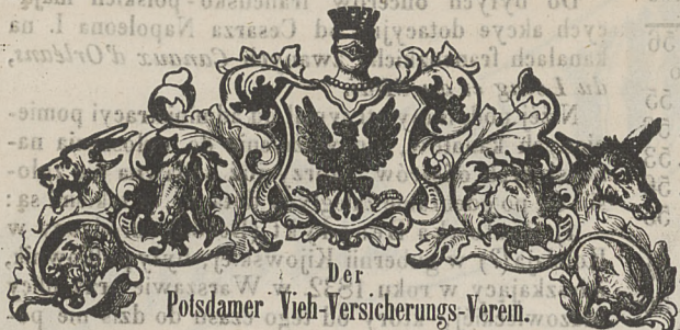
Der Potosdamer Vieh-Versicherungs-Verein.

Wypagrodzenie udziela się, nie tylko w razie śmierci , czy to takowa była naturalną, czy też sprawioną przez przypadkowe jakie nieszczęście, jako złamanie kości, pożar, piorun itd., ale i wtedy, gdy jakowe zwierzę w skutek choroby albo jakiego przypadku , choć żyje, ale niezdolne jest do wszelkiego użytku.