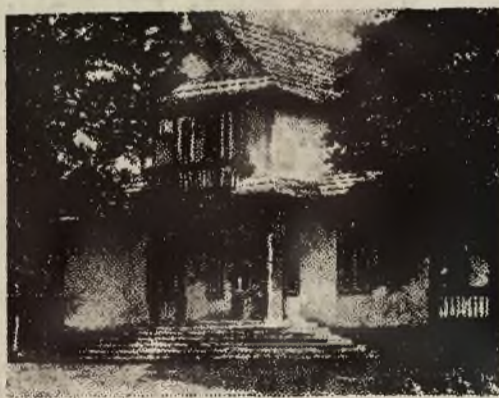
Dom zdrojowy w Wysowej.

przeprowadzenia niezbędnych inwestycji. Spółka, nie mogąc w dzisiejszych warunkach zdobyć potrzebnych środków, postanowiła uzdrowisko sprzedać.