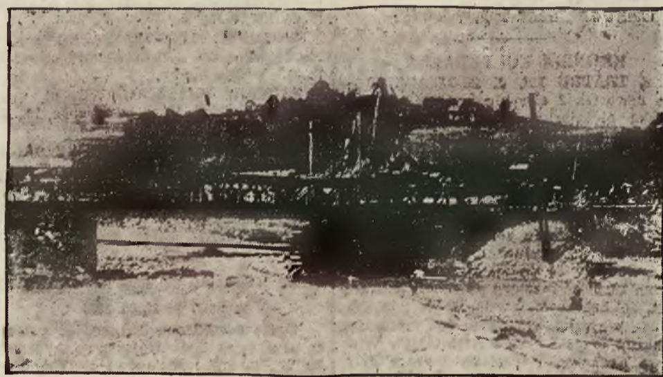
Uszkodzenie toru i mostu kolejowego w Rytrze.