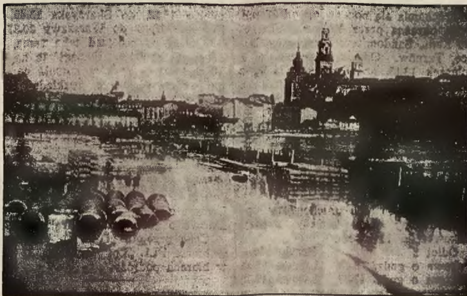
Okolice podwawelska w Krakowie zalana przez powódź.