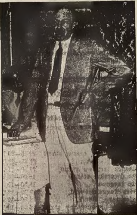
Prezydent Roosevelt na czas swej nieobecności zamianował zastępcę swego, którym jest Donald Richberg.