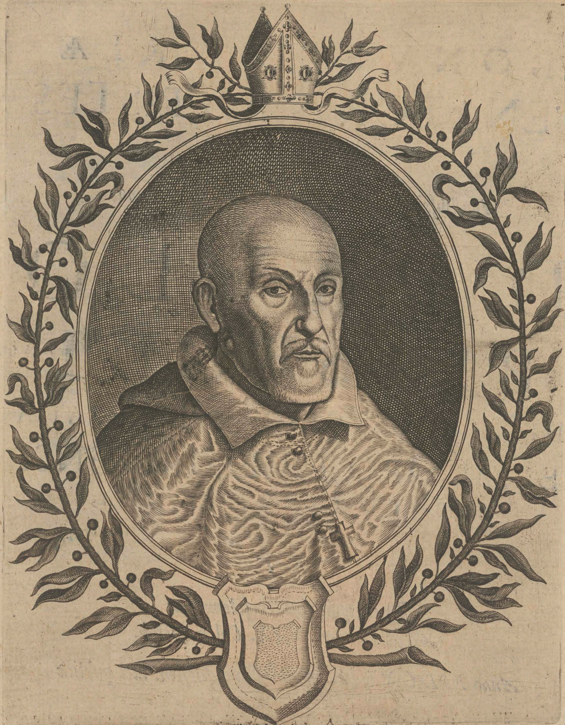
Effigiem cernis PIASECI, laurea cingit Laurea qui scripsit, laurea iure gerit.