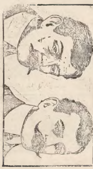
Vor dem Gebrauch. Nach dem Gebrauch. Po użyciu.

Uspokobienie, myśli, czynności i każde poruszenie ciała są zależne od mózgu.