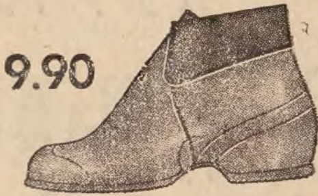
Fason 2862 01

מענער-קאלאשען. קאלאשען סערהיסען דאָס געזונד און די שיך, זעהר דויערהאַט און עלעג.