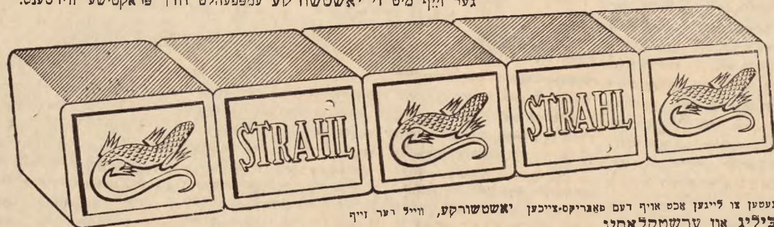
מיר בעטן צו לייגען אכט אויף דעם סאגריקס-זייכען יאשטשורקע, ווייל דער זייף איז ביליג און ערשטקלאסיג

עס דארף געפן א גרויסע האש-פיאנע ביי א קליינעם נוצען. די מעלה פעזיצט דער שמטקעדיג גער זייף מיט די יאשטשורקע עמפעהלט דורך פראקטישע ווירטענס.