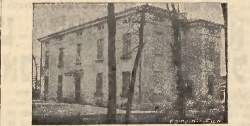
אויסערליכער געבוי פונם יודישען שפיטאל - בנין.

אַ פּאַטער איז געקומען מיט אַ קינד אין שפיטאל-אַמבולאַטאָריום, דער דאָק-