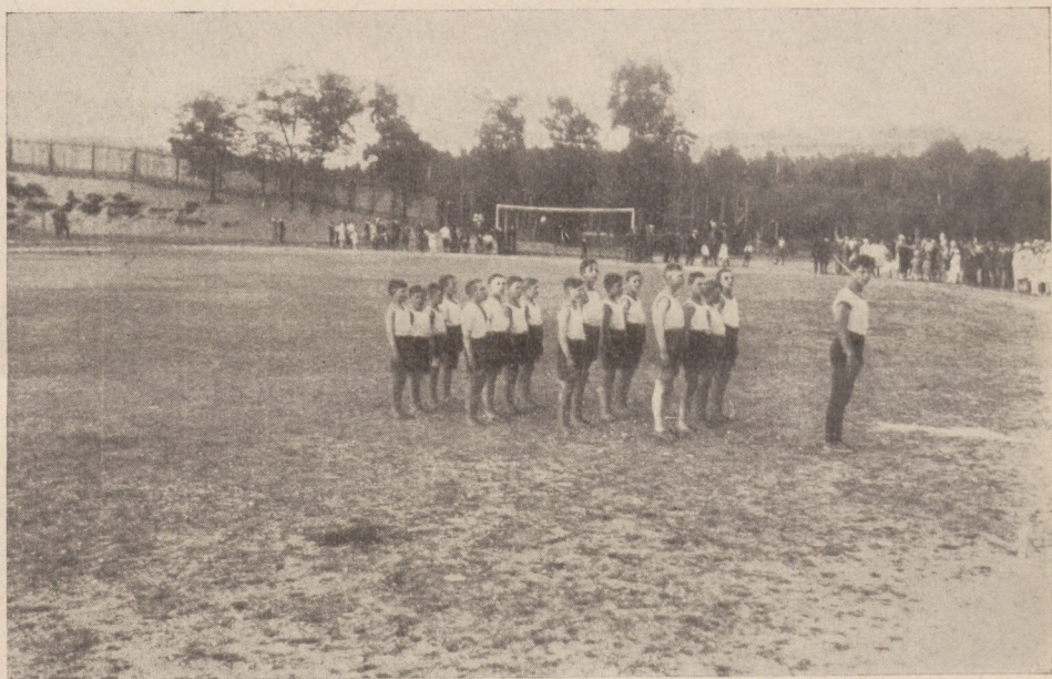
Z półzlotu okr. Jarocin. Odmarsz młodzieży.

Na zakończenie prezes przypomina członkom zarządu, aby przeprowadzili sprawy podwyższenia składek w swych okręgach.