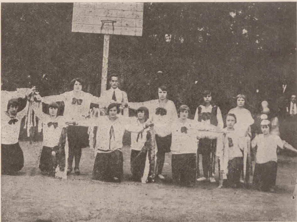
Gniazdo w Limanowej.

O godz. 8,15 uformowany pochód, składający się z 14 sztandarów, 42 druhen i 220 druhów, ruszył z dworca kolejowego przy dźwiękach orkiestry kolejowej z Jarocina na nabożeństwo do kościoła parafjalnego. Po wysłuchaniu kazania i mszy św. i odśpiewaniu „Boże coś Polskę“ nastąpiła defilada przed przedstawicielami władz. Po defiladzie ruszył pochód do Strzelnicy, prowadzony przez