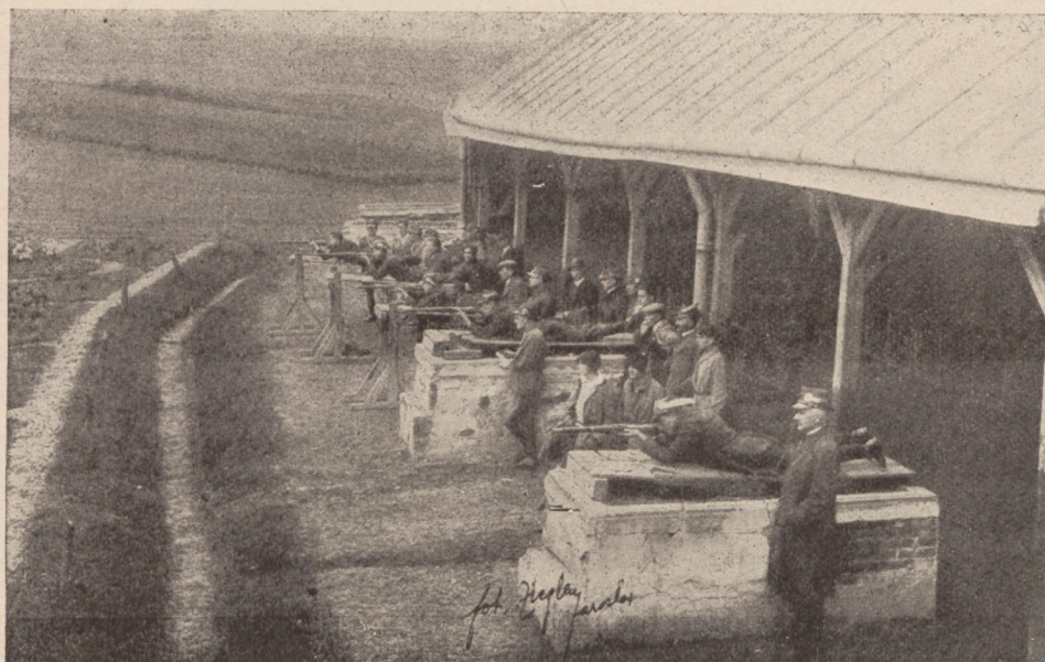
Zawody Dzielnicy Małopolskiej. Strzelanie S. D. S. na strzelnicy związkowej w Jarosławiu.