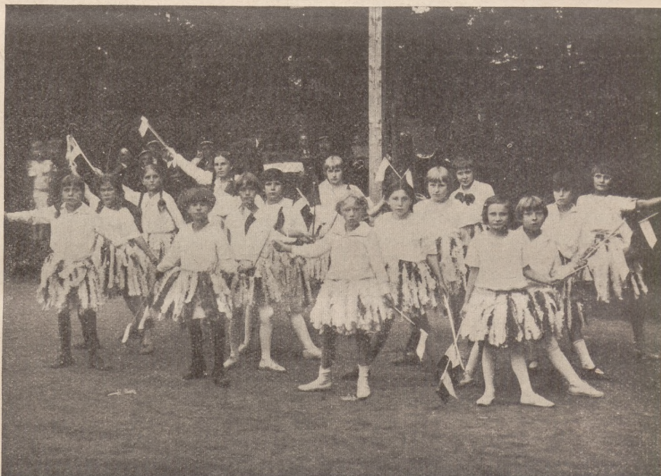
Gniazdo w Limanowej.