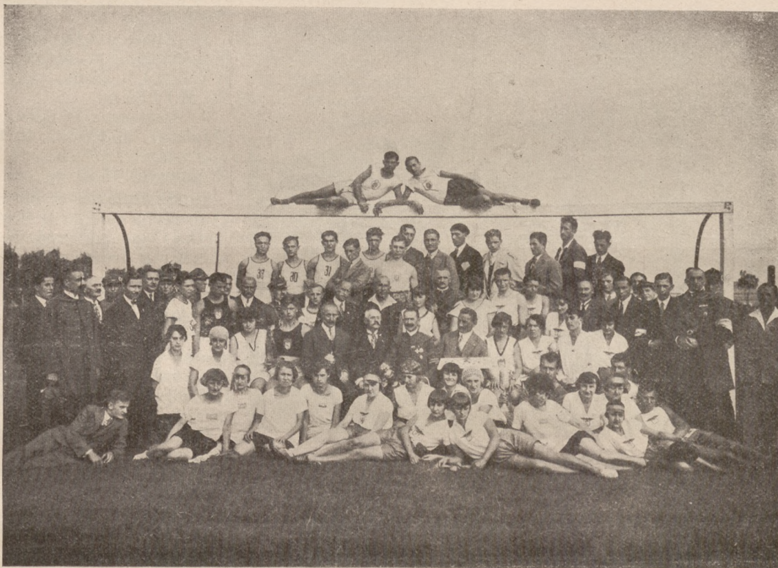
Zawody Dzielnicy Małopolskiej.

Zawody rozpoczęły się w sobotę dnia 22 września o g. 14.30. W dniu tym odbyły się trójboje