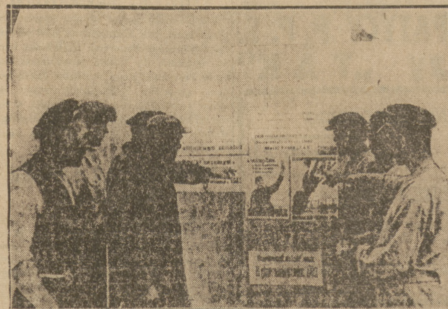
— Będziemy głosowali trzy razy „tak”

Pierwsze pytanie dotyczy zniesienia senatu, który znalazł się w Konstytucji 1921 r. wbrew jednolitej opinii ruchu robotniczego i ludowego, wskutek nieznacznej liczebnej przewagi, jaką wstecznicstwo zdołało wówczas osiągnąć, pozyskując głosy niemieckiej, junkierskiej mniejszości. Niemiecy obszarnicy, przednia straż wrześniowej inwazji hitlerowskiej, zdecydowali o tym, że mieliśmy senat. Wypowiadając się przeciwko senatowi demokracja polska nie wyklucza wprowadzenia w nowej konstytucji obok sejmu ciała doradczego o gospodarczych kompetencjach. Senat — ostoja wstecznicstwa i przywileju, zawsze zwalczany przez ruch robotniczy i ludowy — jest zbędny i nader kosztowny. Ci działacze ludowi, którzy wbrew wskazaniu Wincentego Witosa, Macieja Rataja, Stanisława Thugutta, jak również wbrew własnym wypowiedziom, sprzeniewierzają się swym ludowym sztandarom, występując za utrzymaniem senatu, poświęcają interes ogólny dla doraźnych, partyjnych celów. Kto usiłuje narzucić