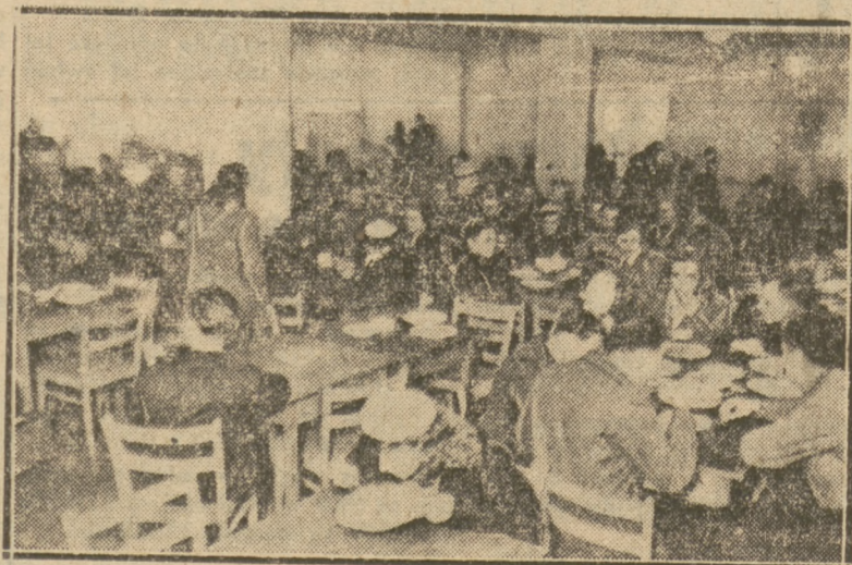
W jadalni jest tłoczno.

Trudności, z jakimi borykają się warszawscy akademicy, są wszystkim aż nadto znane. Mimo jednak całodu, głodu, braku mieszkań, niedostatecznej ilości pomocy naukowych, nie ustają w pracy nad sobą, kształcąc się w niesprzyjających nauce warunkach.