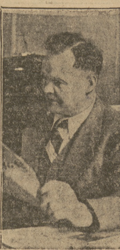
zmyszył, że przewiduje się utworzenie „francuskiej partii robotniczej”, w której połączą się komuniści i socjaliści i która poprowadzi Francję w kierunku nowej demokracji ludowej.

Thorez przypomniał, że francuska partia komunistyczna nie dąży do ścisłego zastosowania programu komunistycznego lecz opracowała program odbudowy gospodarczej. Program ten przewiduje nacjonalizację pewnych gałęzi przemysłu, ale przewiduje również pomoc dla małych i średnich prywatnych zakładów przemysłowych i rzemieślniczych.