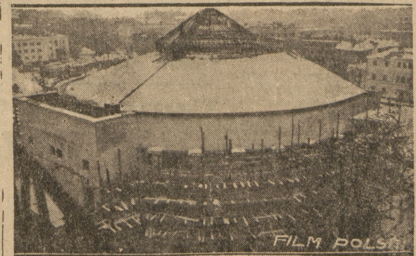
GMACH SEJMU RZECZYPOSPOLITEJ W ODBUDOWIE Wkrótce gmach się zapelni

Umowa między PPS a PPR została zawarta. Została zawarta, zgodnie z uchwałą kierownictwa naszej Partii jeszcze przed wyborami. Front jednolity, będący sekretem zwycięstwa klasy robotniczej, nie tylko nie pękł,