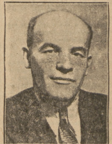
Tow. Władysław Gomułka

Ten fakt — zwiększania się wkładu PPS w dzieło odbudowy musiał spowodować również