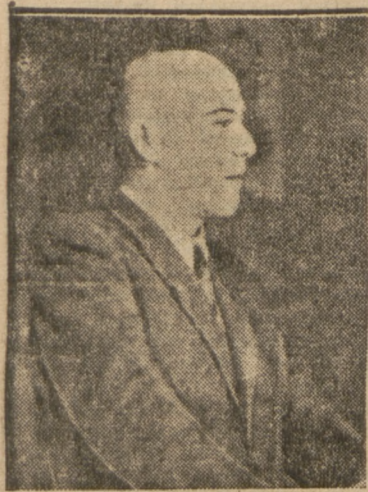
Tow. Józef Cyrankiewicz

Ogłoszona zostanie w najbliższych dniach