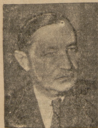
(z wywiadu na str. 3-ej)