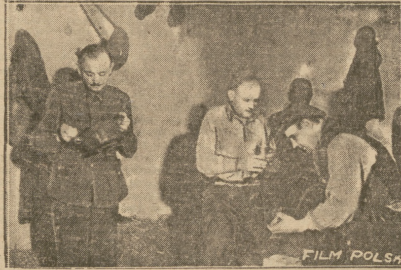
Obiad własnoręcznie przygotowany — dobrze smakuje

wście obrazem przypominającym najczarniejsze dni śmieciowicza. Izby te — co zadziwia — są puste. — Ilu was jest tutaj? — 60 mężczyzn. Kobety odezły już do schroniska na ul. Ludwik. — A gdzie są mężczyźni? — Poszli pracować — odpowiada Jaszukiewicz. — Pracują wszyscy co do jednego w firmach burowanych WDO przy robocie co jak ej się nadają. Zostają tylko chorzy. Rzeczywiście. Po zbite tula się jakieś cienie, które kiedyś, jak mów popularnie porównanie „byli ludźmi”.