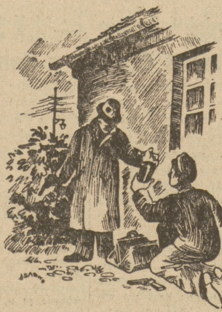
Byli tam ludzie, czekający za stacją

Odcień okrutnego zadowolenia w głosie Lotte sprawił, że Marie poczuła się nieswojo. Była przyzwyczajona do złośliwości tej młodej osoby, złośliwości pensjonarki, mogła ją odeprzeć z łatwością, ale to było coś nowego. „Ona i Paul wiedzą o czymś, co ukrywają przede mną”, pomyślała. Uwaga jej została rozproszona z powodu Anny, która zrobiła się nagle szara na twarzy i pochylała się, opierając łokciem