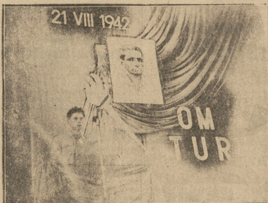
Dekoracja estrady na akademii w Romie