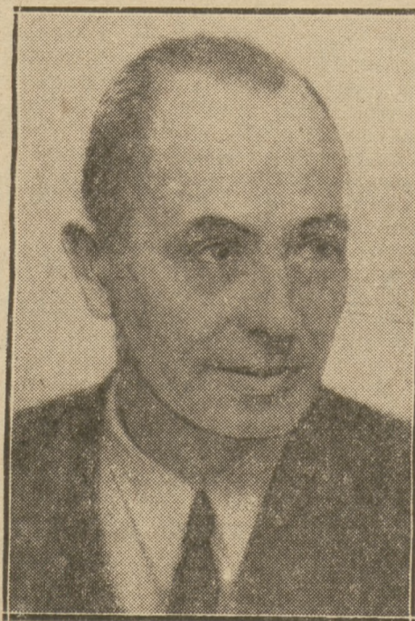
GEORGI POPOW, jeden z czołowych działaczy socjalistycznych, minister Pracy i Opieki Społecznej w rządzie bułgarskim.