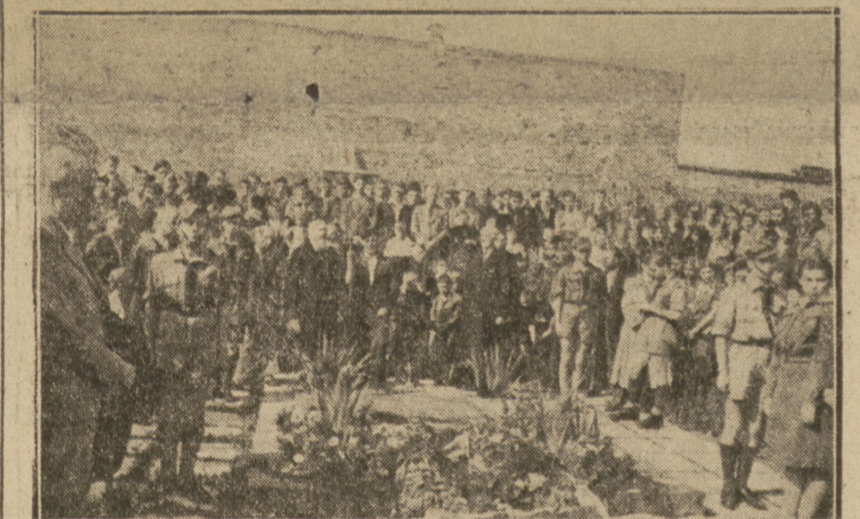
Młodzież szkolna obejmuje w opiekę miejsca egzekucji w Warszawie (róg al. Niepodległości i Madalińskiego).