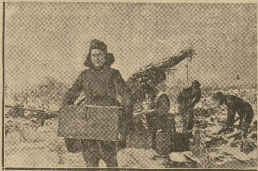
Z DNI WALK WYZWOLEŃCZYCH

Kobiecy bułgarskie w jednym szeregu z żołnierzami brały liczny udział w walkach z Niemcami 1944-45 r.