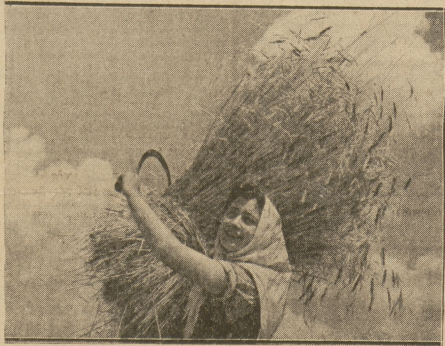
ZNIWA W BUŁGARII

W każdym z tych kółek raz na tydzień odbywają się zebrania, na których odczytuje się sprawozdania z dotychczasowej działalności oraz wysuwają się projekty nowych prac.