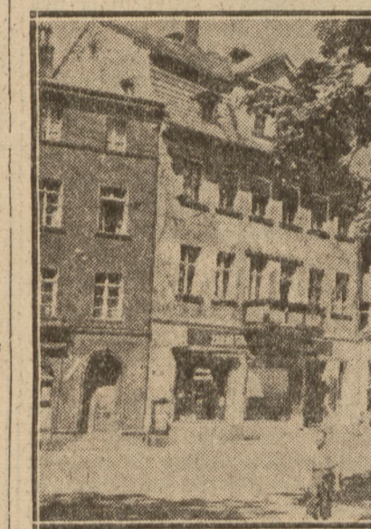
Al. Wojska w Jeleniej Górze