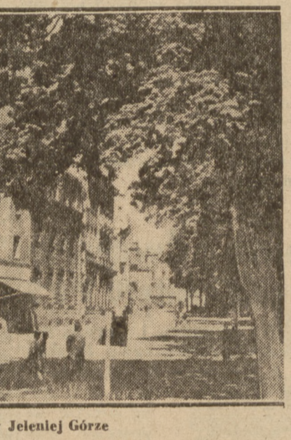
Al. Wojska w Jeleniej Górze