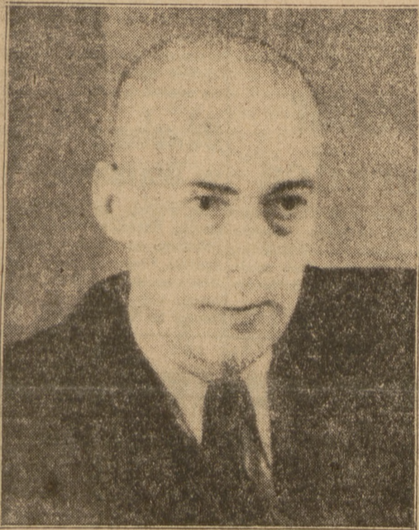
Tow. Józef Cyrankiewicz, Prezes Rady Ministrów i sekretarz Generalny CKW PPS.

Po przemówieniu tow. Cyrankiewicza oświadczenia przedstawicieli partii