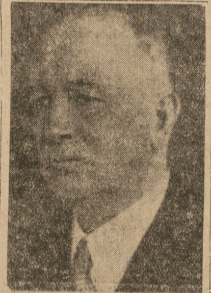
Prezydent Republiki Czechosłowackiej dr. Edward Benes

Prezydenta Rzeczypospolitej dla członków delegacji czechosłowackiej oraz polskich ministrów, biorących udział w uroczystościach.