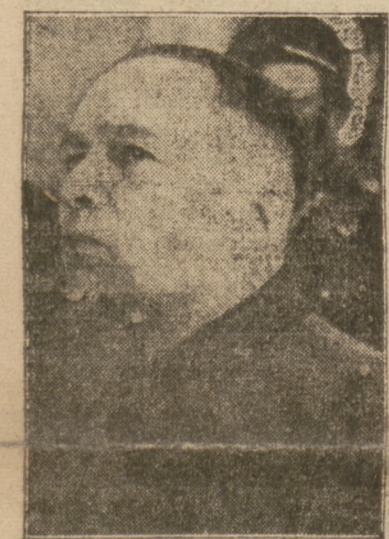
Rudolf Hoess na ławie oskarżonych

W hallu przed wejściem do sali rozpraw na tle sztandarów państw biorących udział w wojnie przeciwko Niemcom, ustawiono tablicę z wymienieniem nazw niemieckich obozów koncentracyjnych: Oświęcim, Majdanek, Dachau, Mauthausen, Gross-Rosen, Buchenwald.