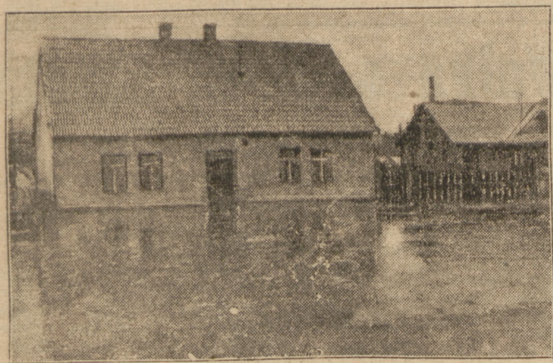
W Białym Prądniku k. Krakowa woda wlewa się do wnętrza domów (Film Polski)