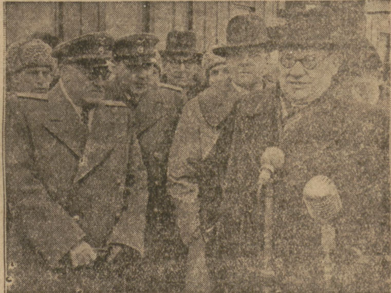
I BEVIN opuszczają stolicę ZSRR.