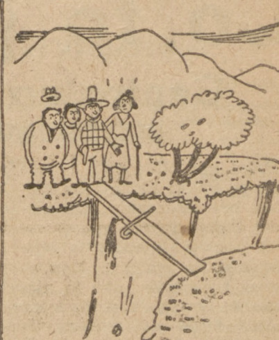
— Otóż mamy przejście na drugą stronę przepaści. Państwo pozwolą za mną. Zdaje się, że nie tak dawno stała tędy jakaś wycieczka.