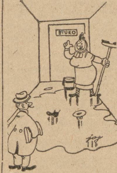
— Niech Pan derektor weźmie roz- pęd i skozy. Pan buchalter też w ten sam sposób dostał się do biura.