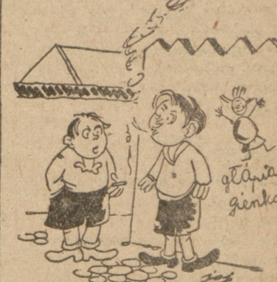
— Ja po pierwszym papierosie nie mogłem się ruszać przez dwa tygod- nie. — Tak ci było niedobrze? — Nie, tylko ojciec sprawił mi ile- kie lanie...