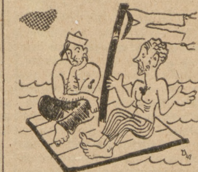
— Co teraz robię? — Nie mam pojęcia. Dotychczas znałem taką sytuację tylko z pism humorystycznych.