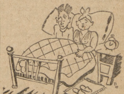
— Mówiłeś przez sen. — O, przepraszam cię bardzo że- li ci przerwałem.