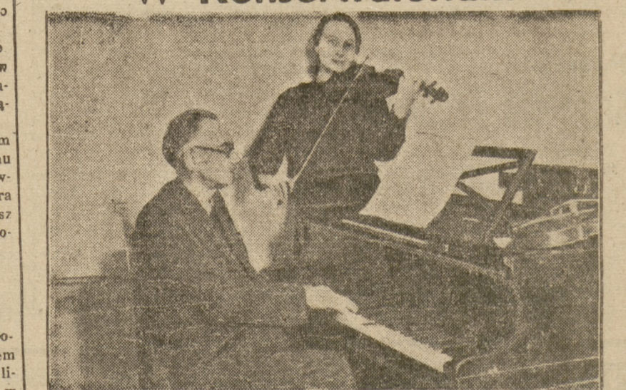
Trudne warunki lokalowe uczelni, nie wpływają na ochłodzenie zapoi słuchaczy. Na zdjęciu ćwiczenie indywidualne na wydziale skrzypiec.