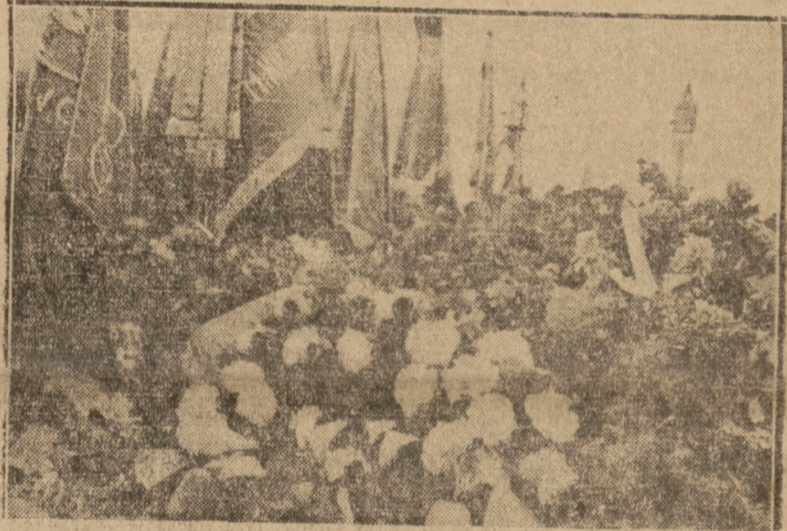
Grób tow. Niedziałkowskiego obsypany kwiatami. Obok widoczne poczty sztandarowe.