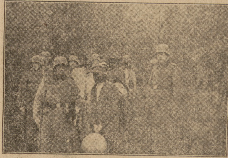
Autentyczne zdjęcie z okresu okupacji znalezione przy zabitym policjancie niemieckim pokazuje grupę Polaków prowadzonych na rozstrzelanie.