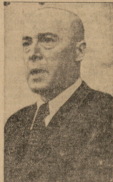
Pan Żulawski się nie zmienił... Wznowienie obrad po przerwie wczorajszego posiedzenia Sejmu Wicemarszałek Barcikowski...