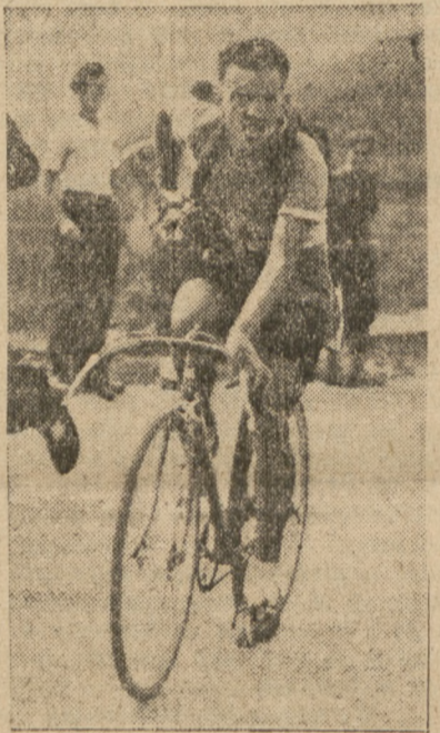
Jeden z najlepszych zawodników raidu rowerowego...